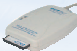
MELAflash® CF-Card-Printer con MELAflash® Tarjeta CF

La documentación sobre las medidas de higiene tiene un significado jurídico cada día más importante. A través de la conexión en serie integrada en el equipo permite conectar la MELAflash® CF-Card-Printers. Esto significa que todos los datos relevantes de cada esterilización se escriben sobre la tarjeta CF automáticamente y luego podemos guardarlas en nuestro ordenador o imprimirlos. Alternativamente podemos imprimir todos los datos de los protocolos a través del ordenador o la impresora de protocolos MELAprint® 42.