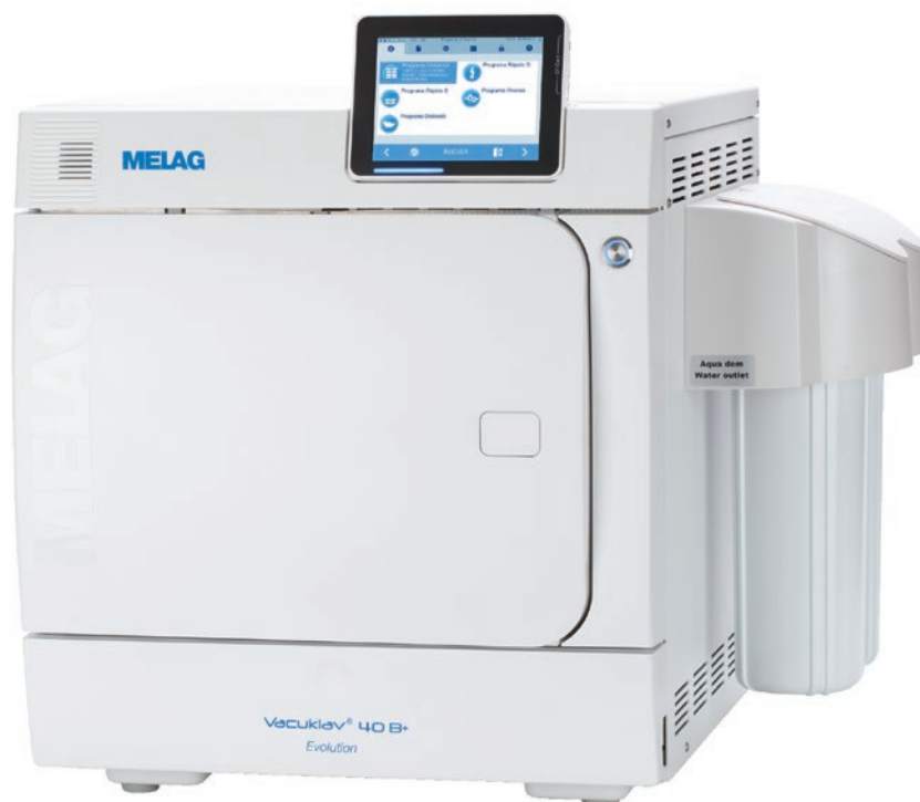
Vacuklav 40 B+ Evolución con MELAdem 40 lateral

Ahorre tiempo y dinero, que utiliza para generar, transportar, guardar y llenar agua destilada o desmineralizada a su autoclave, mediante la conexión a un tratamiento de agua. Si tiene una conexión fija y un drenaje de agua no solamente automatiza el llenado y la dosificación del agua, sino que también es posible el drenaje del agua usada. Desde el pequeño y práctico MELAdem 40 o a través del especialmente muy económico y ecológico sistema de ósmosis inversa MELAdem 47, hasta el sistema de alto rendimiento MELAdem 53, con una conexión simultánea a una termodesinfectadora, ofrecemos para cada modo de uso la solución perfecta.